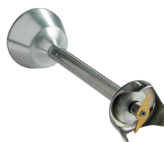
Couteau standard 2 lames Réf. : AC521