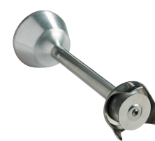
Disque batteur Réf. : AC522