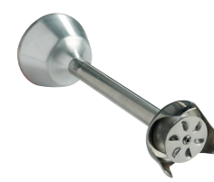
Disque émulsionneur Réf. : AC523