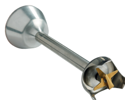
Couteau émulsionneur Réf. : AC520