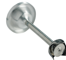
Disque batteur Réf. : AC532