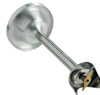
Couteau standard 2 lames Réf. : AC531