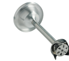
Disque émulsionneur Réf. : AC533